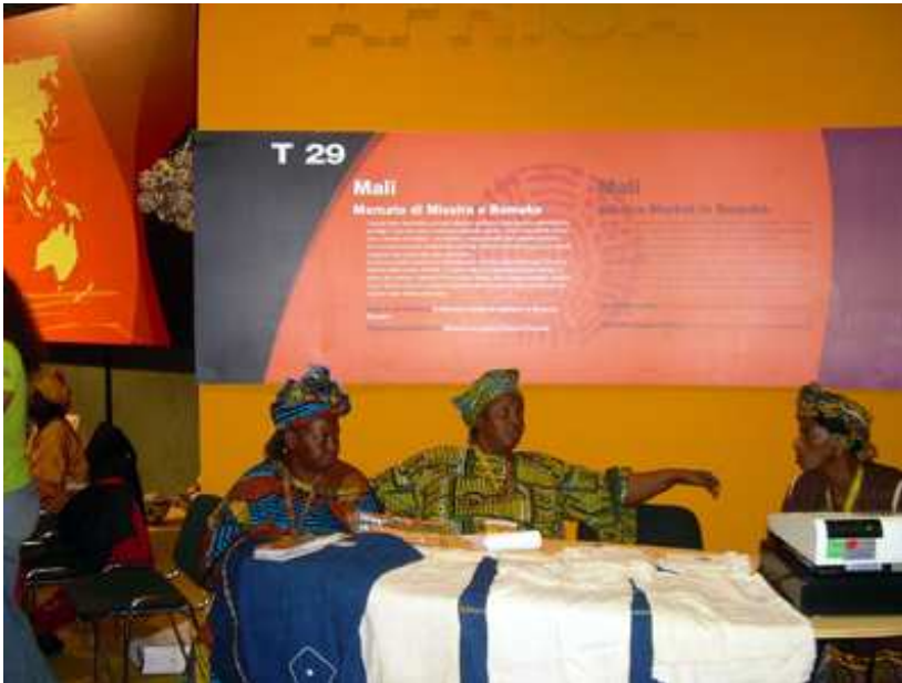
Terra madre – edizione 2006